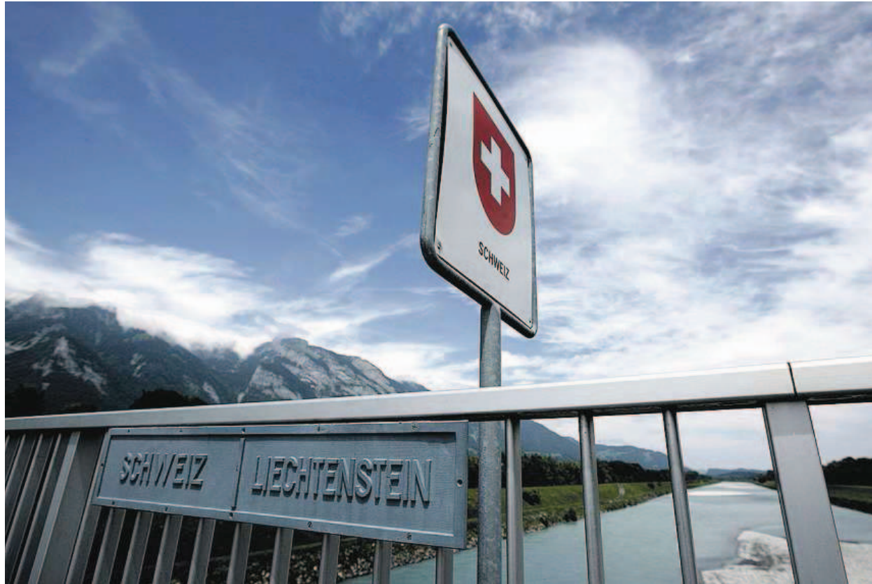
Das neue DBA wird viele Vorteile für Unternehmen und Personen in beiden Ländern bringen.

Die wichtigste Neuerung ist sicherlich der Wegfall bzw. die Reduktion der schweizerischen Verrechnungssteuer (Quellensteuer) auf Dividenden und Zinsen für natürliche sowie juristische Personen mit Wohnsitz/Sitz ausserhalb der Schweiz, wie dies in anderen kürzlich von der Schweiz abgeschlossenen Abkommen geregelt ist. Somit können liechtensteinische Vorsorgeeinrichtun-